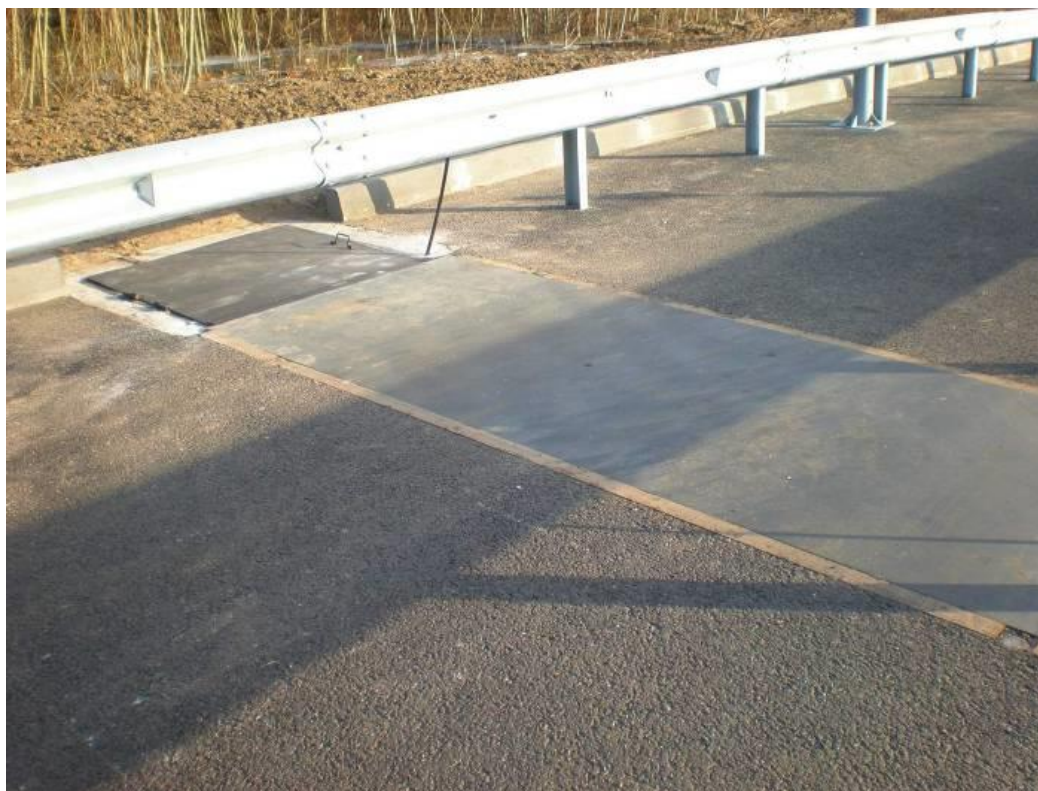
Рисунок 1 – Общий вид встроенного непосредственно в дорогу ГПУ системы с металло-полимерным защитным настилом